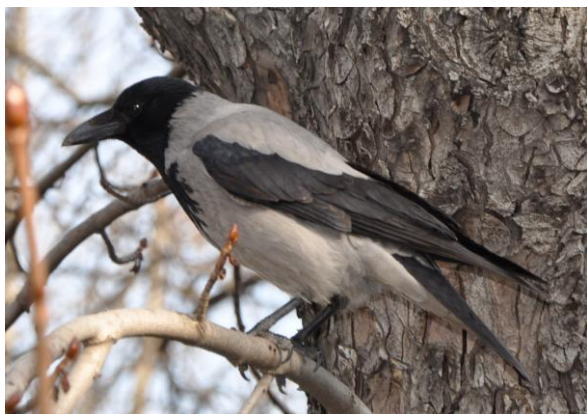
Obr. 5 Vrána šedá.