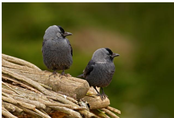
Obr. 6 Kavky obecné.

Riziko: Velká hejna vran mohou způsobit značné ekonomické škody na úrodě (obiloviny, ovoce, luštěniny), projevuje se i predace na drobné domácí drůbeži. Tyto negativní projevy však byly zaznamenány pouze v místech původního výskytu vrány domácí.