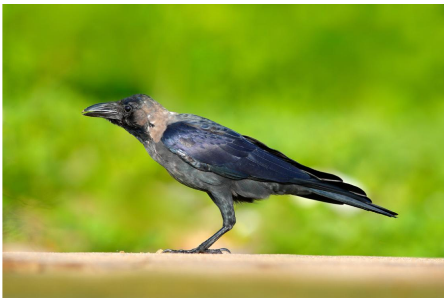
Obr. 3 Vrána domácí má nápadně dlouhé nohy.

v přístavech, zbytky jídel na skládkách či smetištích, případně člověkem pěstované plodiny. Také loví drobné bezobratlé i obratlovce.