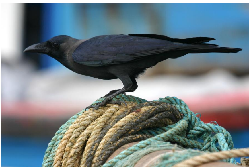
Obr. 4 Typický mohutný zobák.